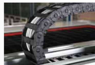
拖链以及线缆均采用igus